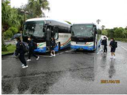
到着時は、まだ雨模様です