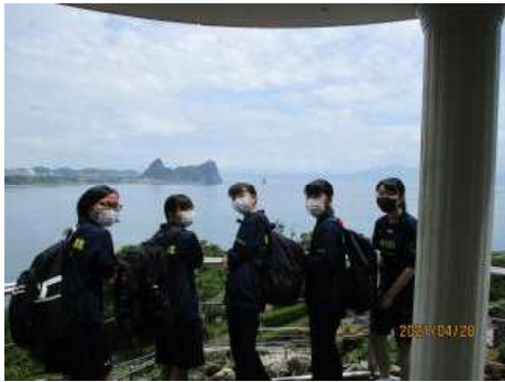
海をバックに撮影!