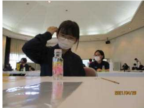
ハーバリウムの製作を体験しました!