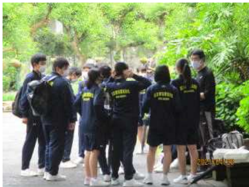
雨も上がり、陽が射してきた!