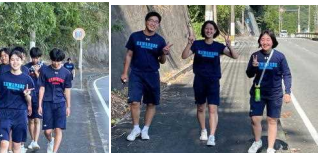
みんな、よく頑張りました