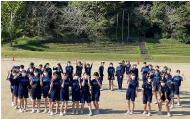
スタート前の3年女子の円陣後の記念撮影

この日、本校の伝統行事である33km遠行が開催されました。今回の記事では、その様子を映した写真をたくさん紹介します。