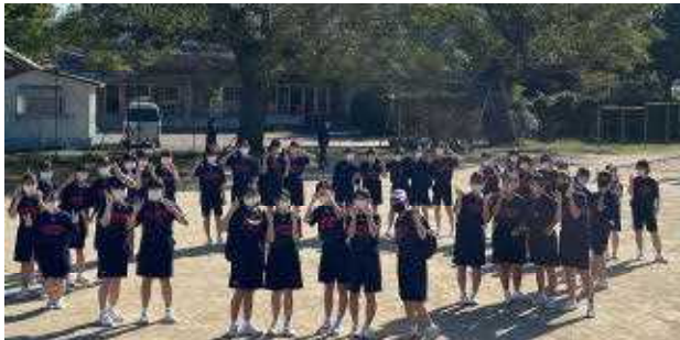
1・2年女子の円陣後の記念撮影