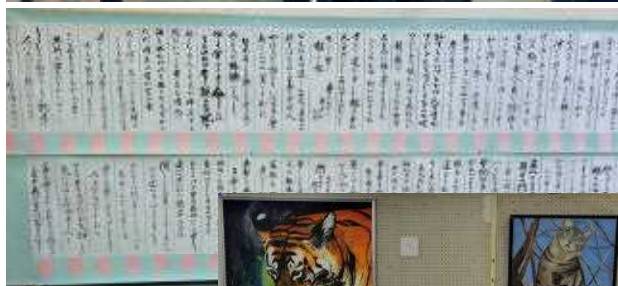
美術・書道部の 展示作品