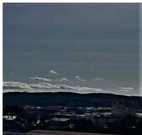
学校の屋上から撮影しました