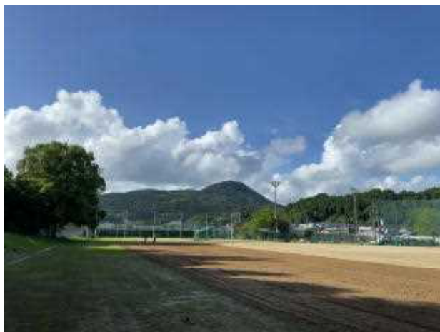
(綺麗な土の色が変わっています。)