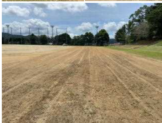
(素晴らしいコンディションになりました)

皆さん、支援して下さいだった同窓生の活動(奉仕)に御礼を言いましょ。私たちは多くの支援を受けて活動できています。グラウンド整備をして下さった方々の思いを追い風であると感じて欲しいものです。そして、体育祭では思う存分、プレーや演技に励み、全力で楽しんで下さい。